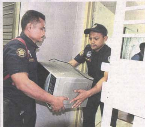
MPAJ enforcement officers seizing moveable properties from an assessment defaulter's apartment.

Expected revenue from assessment for the first half of 2019 is RM90.8mil and the council aims to collect more than 70%.