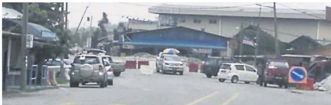
桥断。桥梁重建，主要通道被切