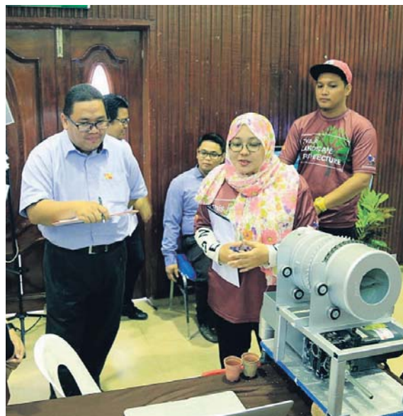
Produk inovasi, Easy Soil Packw yang dipertandingkan di Dewan Merdeka, kelmarin.

"Bagi kategori teknikal produk dimenangi Bahagian Korporat dengan projek Lampu Pejabat Recycle Energy