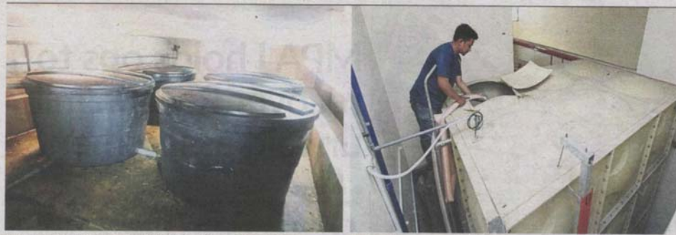
The four spare water tanks at Mon't Kiara Aman Resort Condo connect to taps fixed at each floor for residents' convenience.