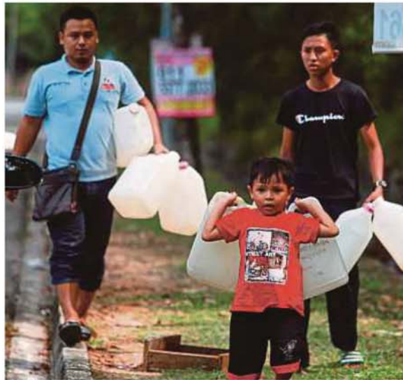
People carrying containers to fill water from public pipes in Seksyen 16 in Shah Alam yesterday.

"Air Selangor is working to ensure that the upgrading works are