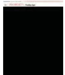
An aerial view of section 13 showing the Atwater site.