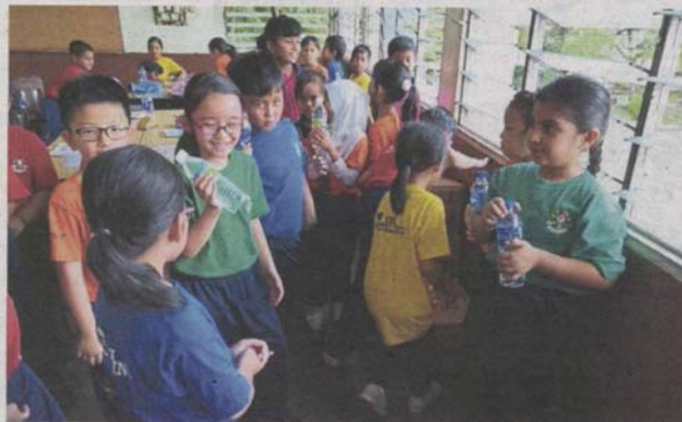
Two mothers distributed 15 cartons of 500ml mineral water bottles to their children's Year Two classmates at SK Sri Petaling on the first day of the water cut yesterday.