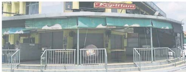
有餐馆业者因制水，干脆直接休业不做生意。