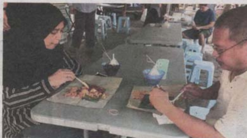
PELANGGAN menikmati hidangan nasi lemak menggunakan pelapik pinggan di salah sebuah restoran di Kampung Baru, Kuala Lumpur semalam.

"Kalau gangguan air melebihi tempoh ditetapkan berkemungkinan saya terpaksa menutup seketika