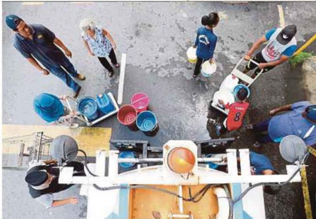
Penduduk terjejas mengisi air dari lori tangki SYABAS di PPR Lembah Permai, Ampang, semalam.