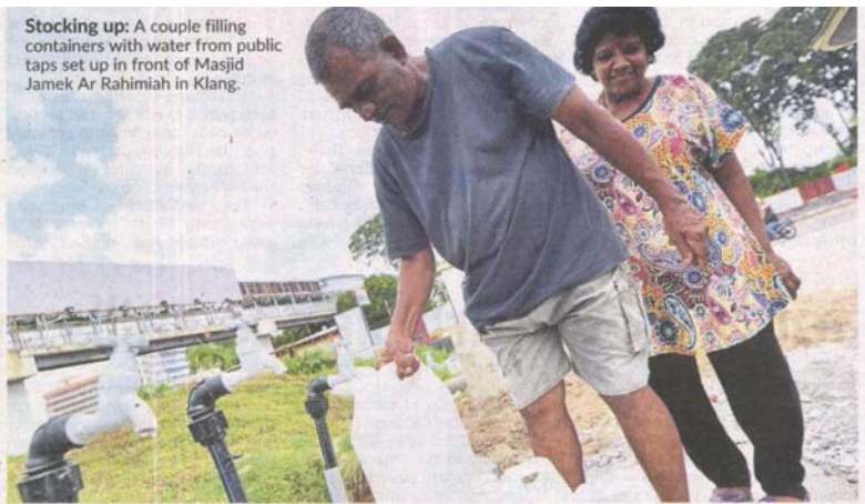
Stocking up: A couple filling containers with water from public taps set up in front of Masjid Jamek Ar Rahimiah in Klang.