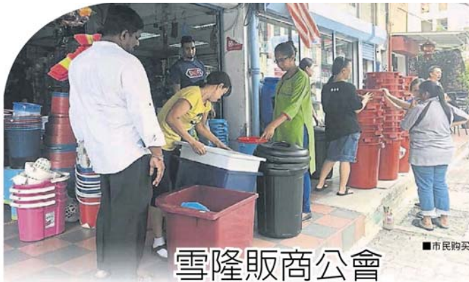
■市民购买水桶储存水。

Provided for client's internal research purposes only. May not be further copied, distributed, sold or published in any form without the prior consent of the copyright owner.