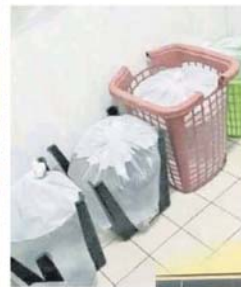
■塑料椅子，也可儲存水。