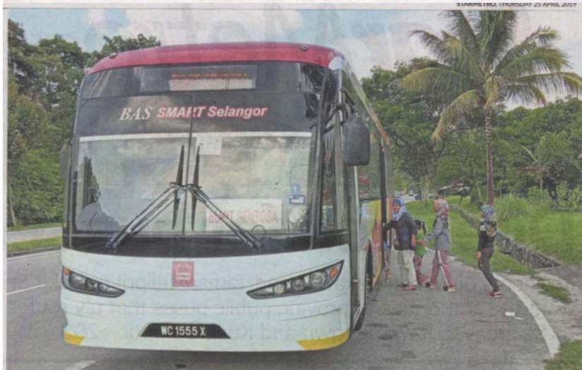
The nearest bus stop for Taman Bakawali and Taman Telipot residents is a 30-minute walk away in Taman Anggerik.

Residents of Taman Bakawali and Taman Telipot in Bukit Sentosa want the authorities to provide public buses that ply routes from these areas to Rawang town and Kuala Lumpur. >2&3