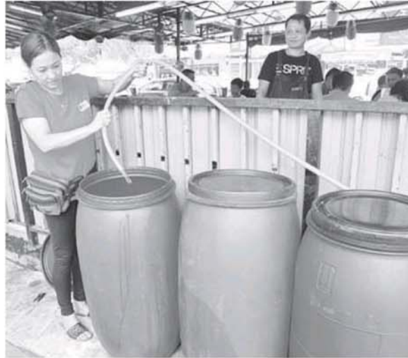
雪隆577个地区周三起制水，许多民众已开始储水，以备不时之需。