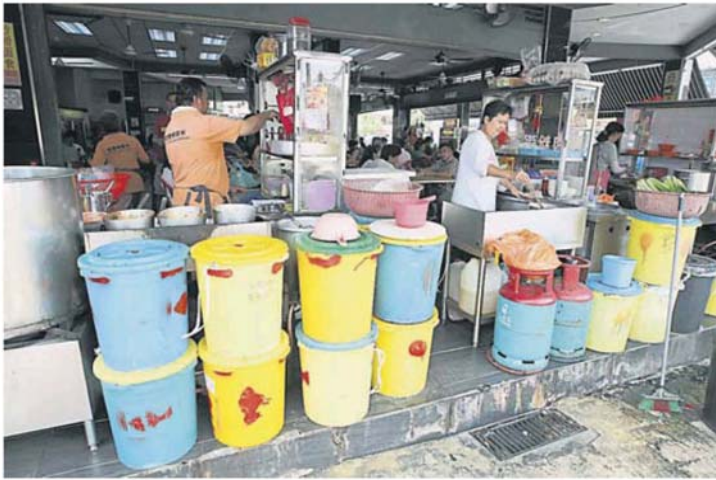
不少小贩在档前堆放了多个蓄满水的水桶。