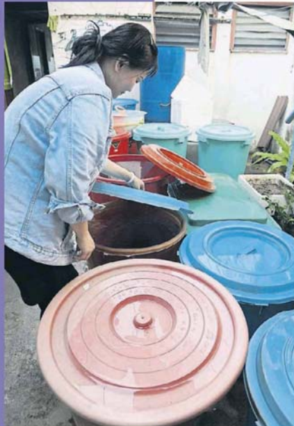
斷水期已開始，商家們現今使用的都是之前存下的水供。

水用完就休息 据知，大城堡一些食肆为免遭遇断水带来的不便，已干脆选择停业到供水恢复为止，有者则选择调整休息日，希望重开那天，水供已全面恢复。 商贩说，这次断水影响是无可避免，加上水供公司都有提早通知，相信大家都会给予体谅。 他们指出，之前已把水桶和水桶盛满，估计还能撑个两天，最后真是熬不过去，只能选择停业。 一些商贩甚至已做好打算，为节省用水量，之后或暂时改用纸碟来应对。 有者说，熟食业需要大量水供，之后或需从他处运水到商店。他们指出，熟食业的卫生很重要，即使处于断水期，他们也会进行例行的卫生工作。