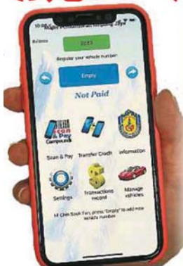
一旦雪州政府統一以“精明雪蘭莪泊車”手機應用程式繳付泊車費，繳付泊車費的方式更為簡易及方便。(檔案照)