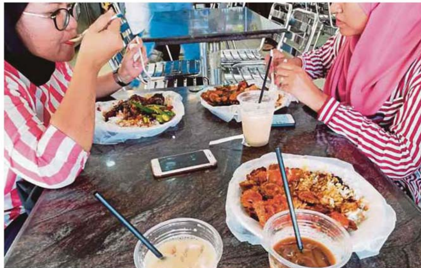
Customers having their meals with disposable plastic utensils, plate liners and cups at Restoran Khulafa Seksyen 7 in Shah Alam yesterday.

Wahith said previous water cuts lasted only 48 hours at the most, adding that he hoped supply would be restored earlier