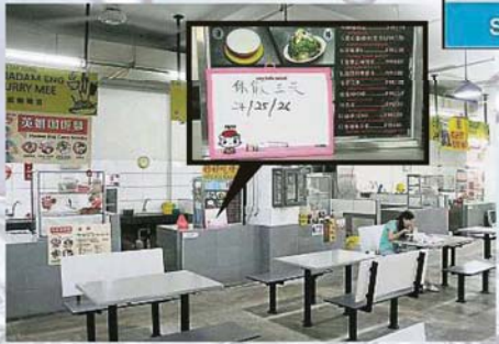
半山芭综合商业广场内有部分熟食小贩因制水停业3天, 避免不便

雪兰莪河第二期滤水站提升工程于24日早上9时全面展开, 截至下午5时已完成70%。