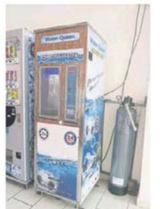
面對長時間的斷水，許多民眾會到外取水應對。