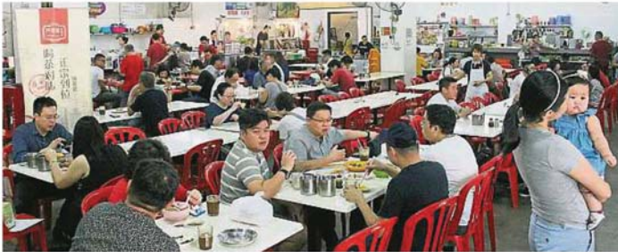
大部分餐饮店照常营业，光顾人潮未受影响。

Provided for client's internal research purposes only. May not be further copied, distributed, sold or published in any form without the prior consent of the copyright owner.