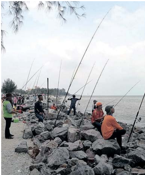
Pantai Remis yang sesuai untuk pertandingan memancing.

KUALA SELANGOR - Hadiah bernilai lebih RM130,000 bakal menjadi rebutan pada pertandingan memancing sempena program Tourism Malaysia Surfcasting Tour A Journey To Visit Malaysia 2020 , di Pantai Remis, Ahad ini.