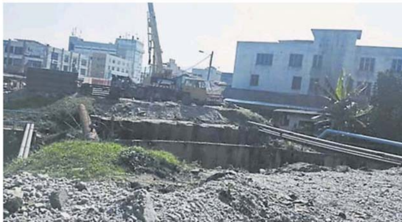
地下电缆移置和征用土地问题，士毛月街上大路衔接万宜路的桥梁重建工程被迫拖延。