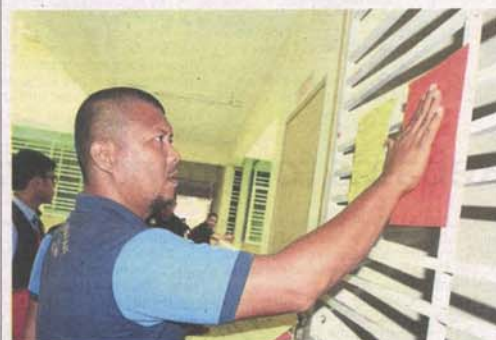
An MPAJ officer pasting a notice on a unit where the occupants are not home.