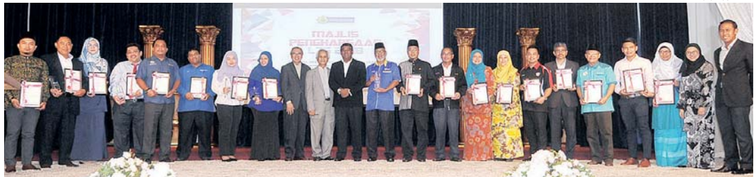
Penerima anugerah Majlis Penghargaan LZS 2018 bergambar selepas tamat majlis di Shah Alam semalam.

Lembaga Zakat Selangor (LZS) menyasarkan kutipan sebanyak RM840 juta untuk kutipan zakat pada tahun ini.