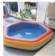
■兒童泳池，盛水成用具。