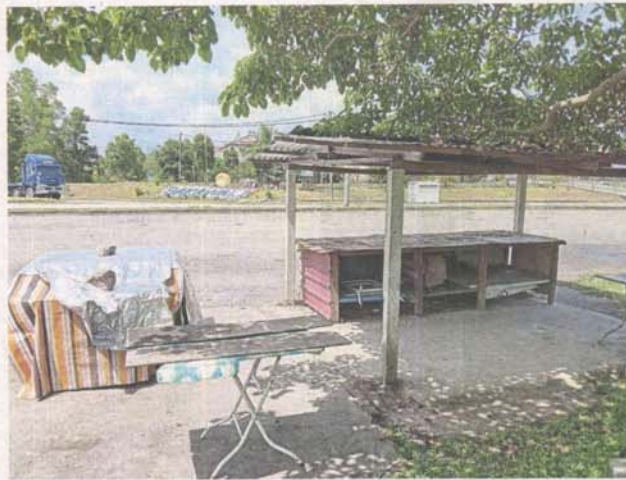
Taman Bakawali and Taman Telipot residents are proposing to have a bus stop where the Bukit Sentosa 3 night market site is located.

Kuala Kubu Baru-Bukit Sentosa-Rasa route.