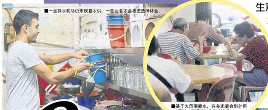
一旦存水耗尽仍未恢复供水，一些业者才会考虑选择停业。