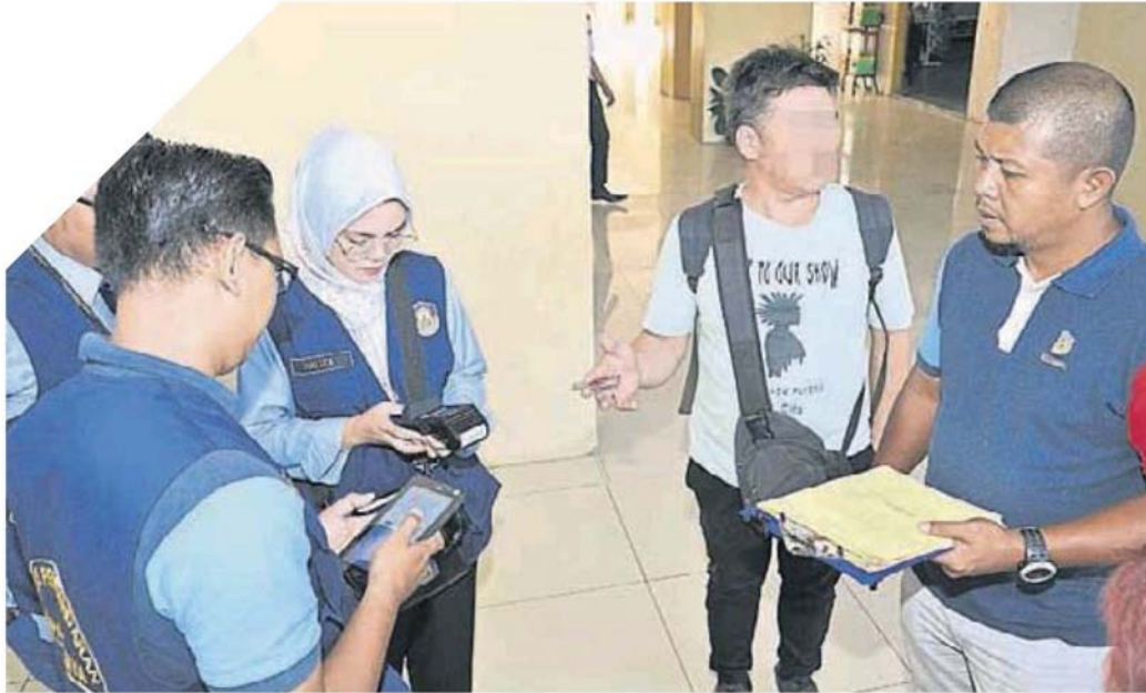
■ 业主可以用刷卡方式缴付拖欠的门牌税。