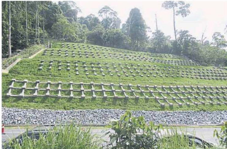
■双溪德加里路第0.5公里处的山坡已完成修复, 山坡保存绿色环境。