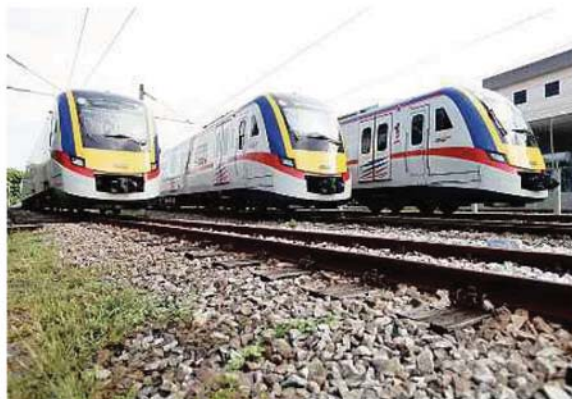
More transit-oriented developments in Selangor will increase the use of public transport. FILE PIC

Amirudin said the development would make a provision for desirable and affordable housing and good connectivity, simultaneously looking into