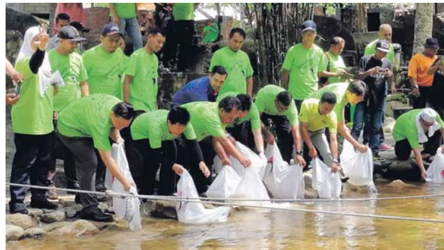
Pelepasan anak ikan lampam sempena Majlis Perasmian Program Hari Bumi 2019 Peringkat Negeri Selangor, semalam.

"Tidak wajar kita membiarkan salah laku ini memusnahkan ekosistem sungai dan alam sekitar yang menjadi nadi kehidupan pelbagai spesies," katanya pada perasmian Program Hari Bumi 2019 Peringkat