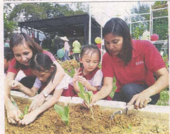
Students and teachers of R.E.A.L Kids USJ 12 planting vegetables at the neighbourhood's community garden to celebrate Earth Day.