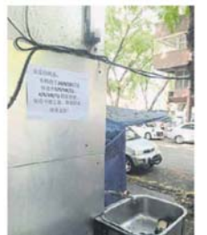
一家茶室直接張貼告示，提醒顧客會休業。