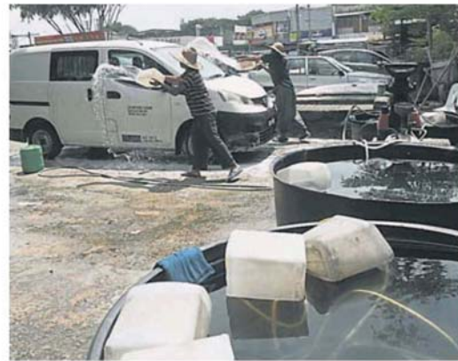
洗车业者将在存水用完后，考虑休业。