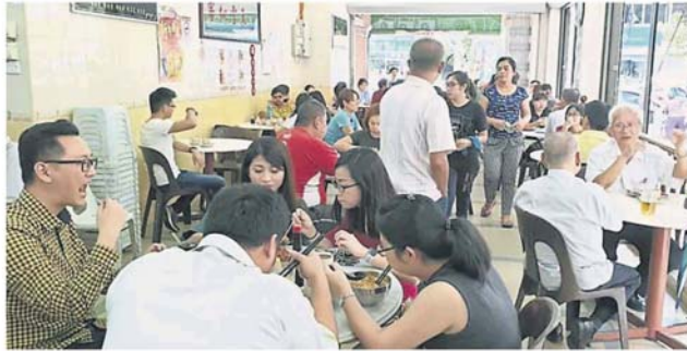
中午时段，多家餐馆客似云来，完全不受制水影响。